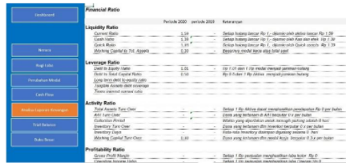
Gambar 6. Analisa Financial Ratio

Gambar 5, Menyampaikan informasi detail dari trial balance dan data entry dari masing-masing aktivitas keuangan yang terjadi pada mitra berdasarkan Chart of Account (COA) yang telah disepakati sebelumnya. Penyampaian trial balance ini memberikan keterangan detail dalam pengembangan sistem ini sehingga memudahkan dalam pengaturan alur dan akun aktiva yang dimiliki.