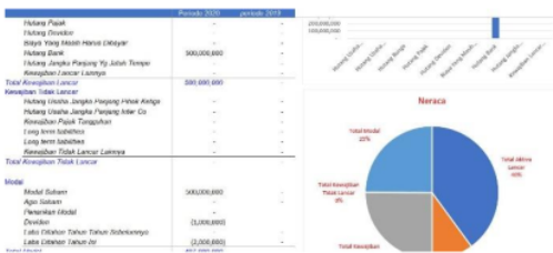
Gambar 4. Tampilan Laba Rugi

Pada gambar 3 dapat dijabarkan neraca aktiva dari mitra yang telah didata sehingga mengetahui status aktiva yang lancer dan tidak lancer. Aktiva yang tidak lancer ini menjadi sebuah peringatan tersendiri sehingga membantu mengurangi piutang usaha dan pengembangan UKM itu sendiri.