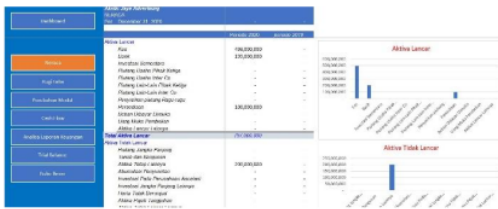
Gambar 3. Tampilan Neraca Aktiva

Setelah melampaui proses pengembangan sistem, maka berikut adalah beberapa tampilan antar muka dan fitur yang telah disepakati oleh mitra dengan tim peneliti. Pengembangan sistem ini melalui proses pendekatan akuntansi, sehingga seluruh alur dan proses khususnya untuk alur jurnal keuangan hingga terjadi neraca telah tervalidasi.