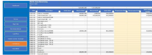
Gambar 5. Detail Trial Balance

Ditilik dari gambar 4, dapat disampaikan terkait proporsi dari masing-masing neraca, hal ini diharapkan mampu membantu mitra UKM dalam melihat informasi keuangan dan kondisinya secara nyata dan real time, sehingga membantu dalam proyeksi keuangan ataupun rencana pengembangan kedepannya.