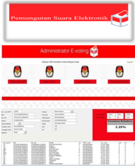
Gambar 2. Rancangan Program