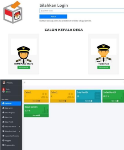
Gambar 3. Hasil Tampilan Web

Pada sisi administrator dikembangkan dengan bahasa pemrograman web yaitu PHP dan database MySql. Sedangkan di sisi pemi 1 (user) dikembangkan berbasis website. Berikut hasil aplikasi yang sudah dikembangkan, bisa dilihat pada Gambar 3.