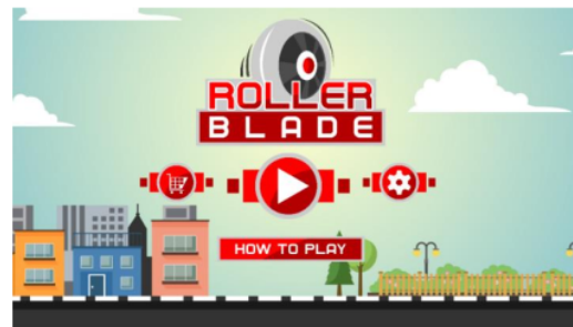
Gambar 3. Tampilan Menu

Rancangan antarmuka merupakan tampilan game yang diusulkan oleh penulis. Pada uraian di bawah ini dapat dijelaskan rancangan antarmuka sistem dari Game Roller Blade.[11]