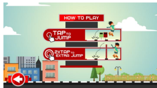
Gambar 4. How to Play