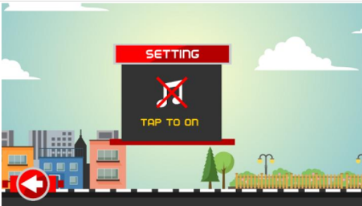
Gambar 5. Setting Sound