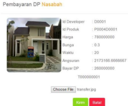
Gambar 5. Halaman upload bukti pembayaran DP

Halaman ini berfungsi untuk upload bukti pembayaran Dp nasabah untuk mendapatkan surat pengajuan SHGB (Surat Hak Guna Bangunan)[8].