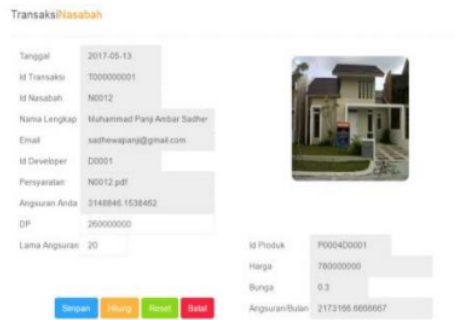
Gambar 4. Halaman Transaksi

Merupakan halaman yang berfungsi untuk mencari informasi dimana kemampuan angsuran nasabah yang akan menjadi perbandingan dari hasil Dp dan waktu serta bunga untuk mengajukan KPR[6]. Berikut akan di gambarkan hasil dari konsultasi yang lanjut ke pengajuan KPR.