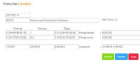
Gambar 3. Halaman Konsultasi

Pada halaman persyaratan ditunjukkan bahwa kelengkapan persyaratan menggunakan metode Regular Grammar[5]. Sebagai contoh nasabah dengan nama Muhammad Panji Ambar Sathewa telah melengkapi persyaratan. Metode ini terhenti oleh logika fuzzy tsukamoto untuk konsultasi pendapatan dan pengeluaran. Dapat di gambarkan sebagai berikut